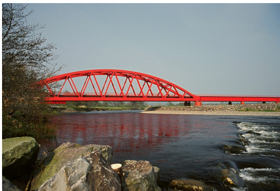
Slika 1 - Slike i nazivi slika se centriraju (10pt, italik, before i after 6pt) i pišu se i na srpskom i na engleskom jeziku